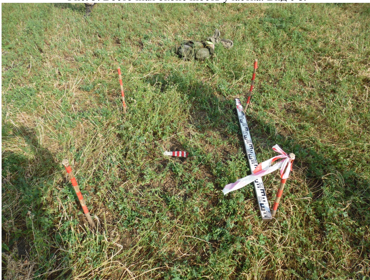
Рис. 6. Шурф 1 перед началом работ. Вид с 3.