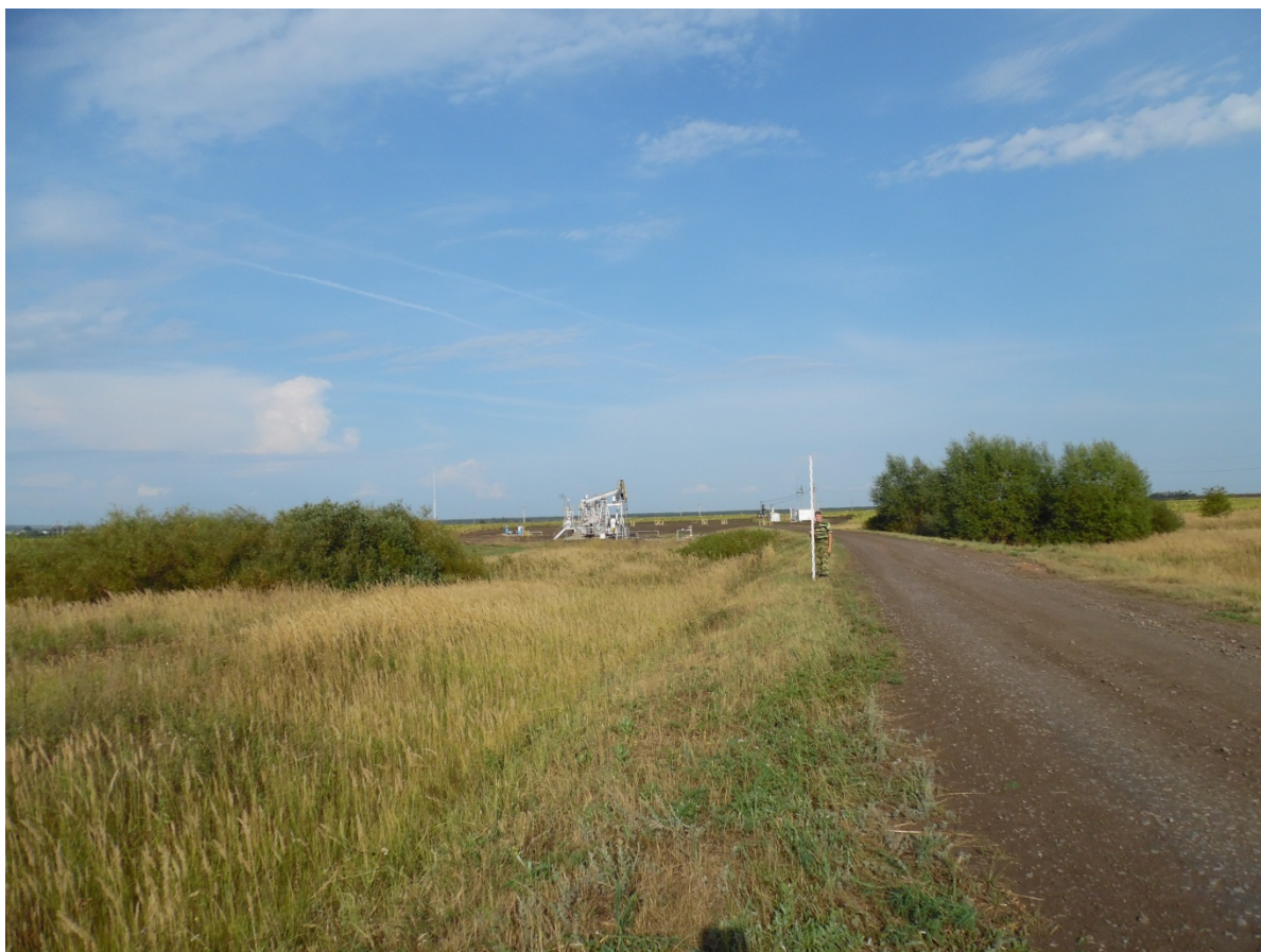
Рис. 5. Восточная оконечность участка. Вид с 3.