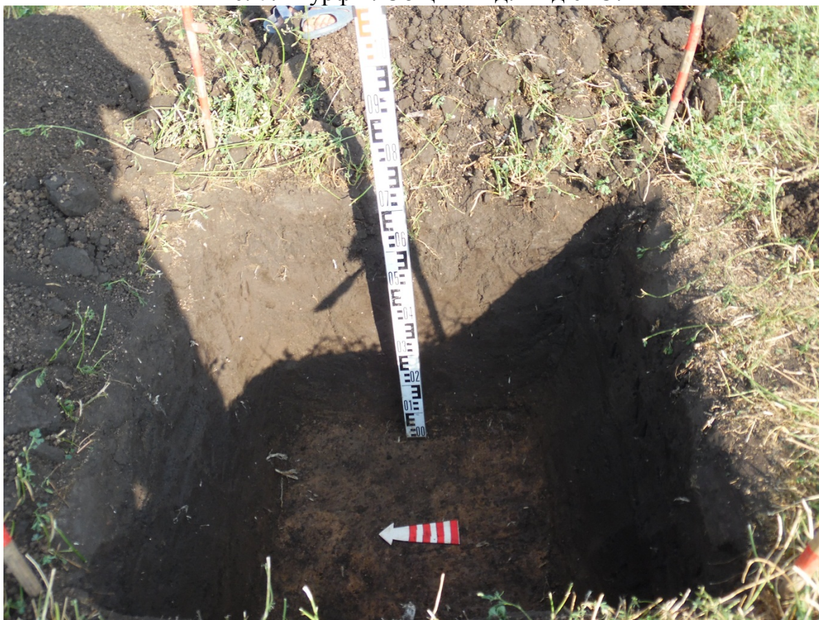
Рис.8. Шурф 1. Профиль восточной стенки. Вид с З.