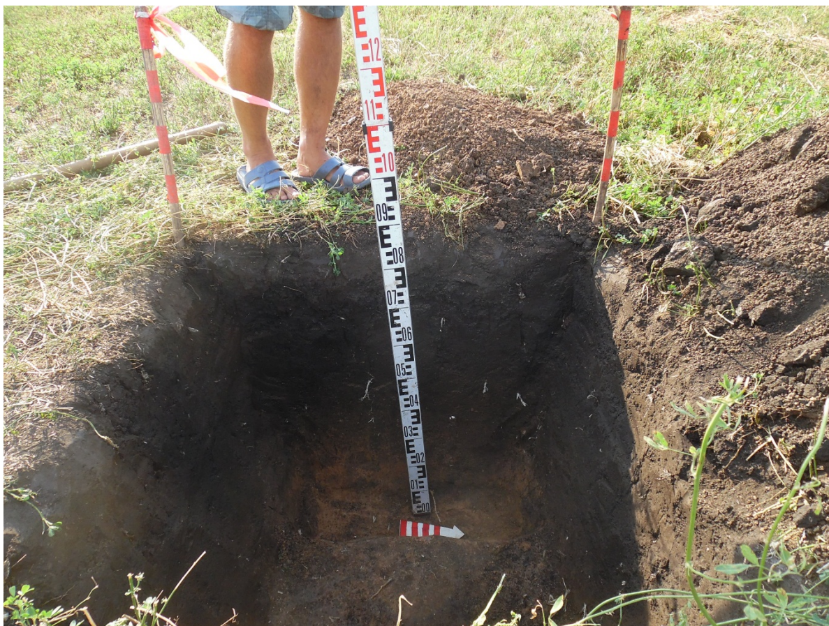
Рис. 9. Шурф 1. Профиль западной стенки после прокопки материка.