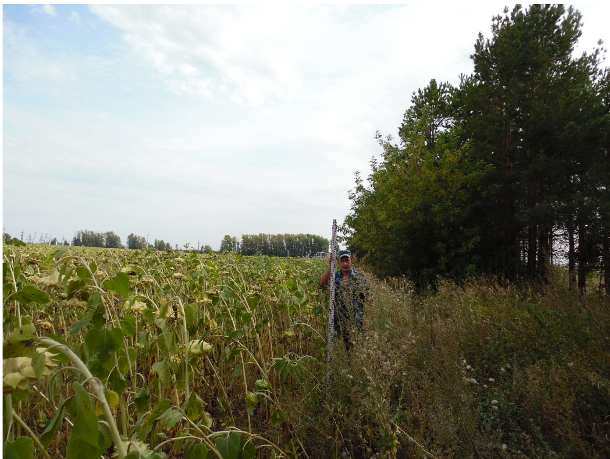
Рис. 3. Восточная часть участка. Вид с С.