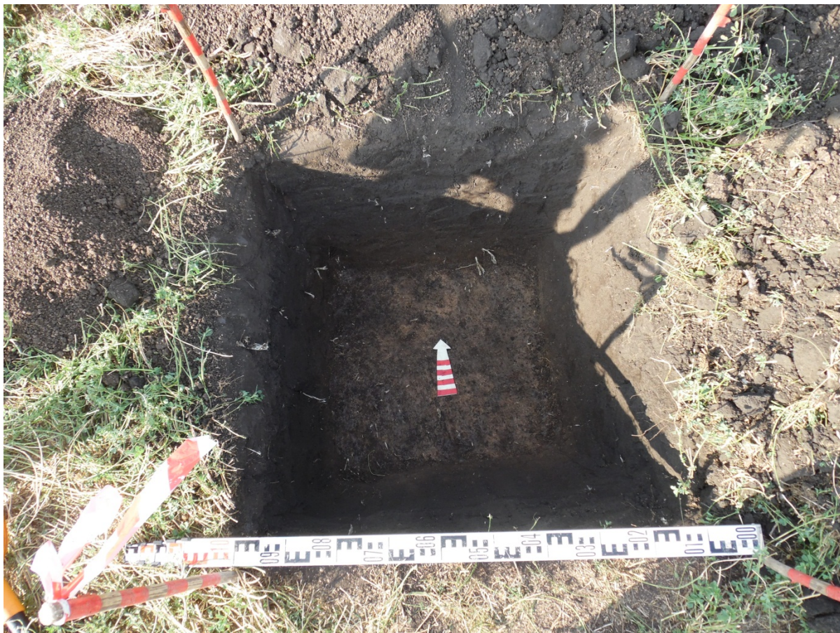
Рис. 7. Шурф 1. Общий вид. Вид с Ю.